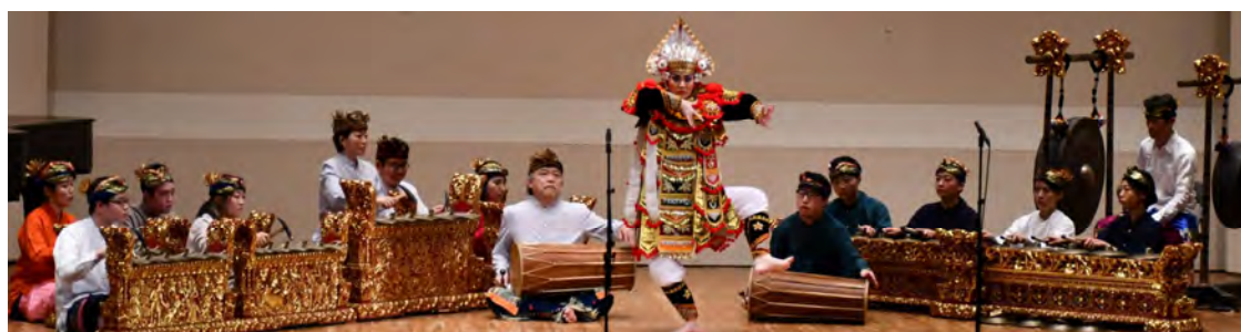
ガムラン演奏と舞踏