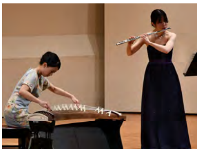
フルートと箏(そう)のアンサンブル