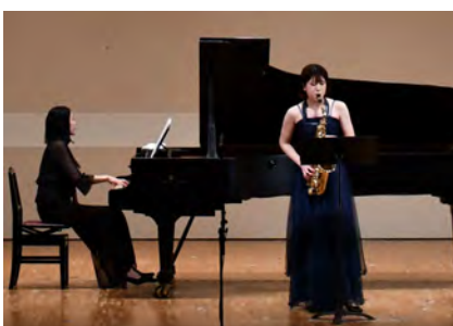
サクソフォン演奏