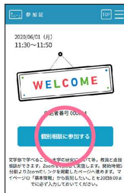
スワイプ後の画面